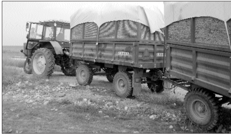
Hər gün tonlarla pambıq məntəqələrə yola salınır

Qeyri-neft sektorunun, xüsusən də kənd təsərrüfatına bağlı ənənəvi sahələrin inkişaf etdirilməsi istiqamətində atılan addımlar artıq müsbət nəticəsini verməkdədir. Bu səmərəlilik hər regionun abı-havasından asılı olaraq əziyyətə sinə gərməyi bacaran, əlinin qabarına, alınının tərinə güvənən, əldə etdiyi məhsulun mənfəətini görüb onun sevincini yaşaya bilən hər kəs üçün var. Özünəməxsusluğu, zəhmətkeş insanları ilə seçilən Hacıqabul rayonu da belə rayonlardandır.