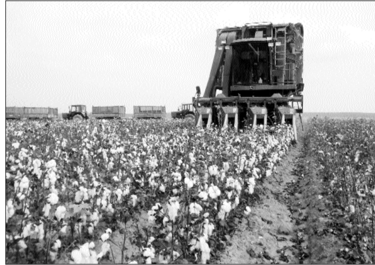
İtirilmiş sərvət geri qaytarılır