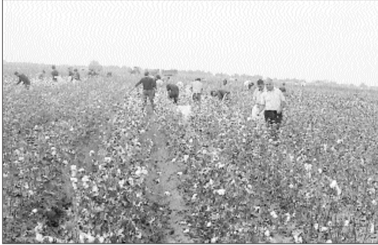
İnsanlar yenidən pambıq tarlalarına qayıdırlar