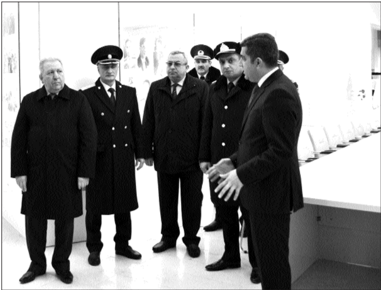
Azərbaycanın görkəmli siyasi və dövlət xadimi, xalqımızın Ümummilli lideri Heydər Əliyevin vəfatından 14 il keçir. Bu dahi insan Azərbaycan xalqının yaddaşında qurucu və xilaskar

dövlət xadimi, milli lider və xalq məhəbbətini qazanan öndər kimi qalmışdır. Xalqımızın tarixi taleyində, mənəvi, siyasi və ictimai həyatında, dövlət quruculuğunda onun qədr misilsiz xidmətlər göstərən ikinci dövlət adamı tapmaq mümkün deyildir. Bu mənada o, xalqımızın milli iftixarı, ürəklerimizdə özünə yer tapan milli liderimiz, güvənc yerimiz, qürur duyduğumuz və arxa bildiyimiz böyük Azərbaycanlı idi.