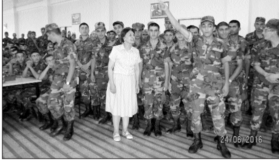
Azərbaycan Silahlı Qüvvələrinin 98-ci ildönümü ərəfəsində Azərbaycan Təhsil İşçiləri Azad Həmkarlar İtti-