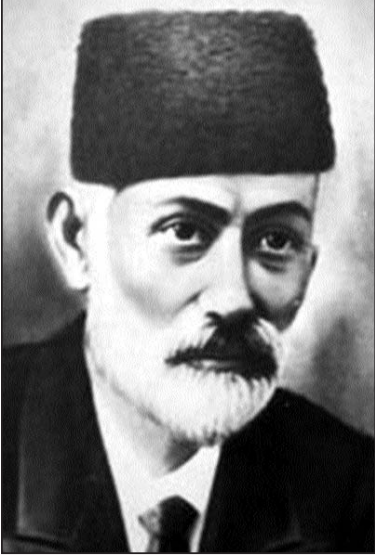
(əvvəli səh. 1-də)

Milli mətbuat günü ərəfəsində Azərbaycanın bütün bölgələrində olduğu kimi fəaliyyət göstərdiyim Hacıqabul rayonunda da bu peşə bayramı böyük ruh yüksəkliyi ilə qeyd olunur. Bu ərəfələrdə redaksiya heyəti qəzetin fəal oxucuları ilə, yerlərdə qəzetin fəal yazarları ilə görüşlər və onlarla oxucu konfransı keçirir.